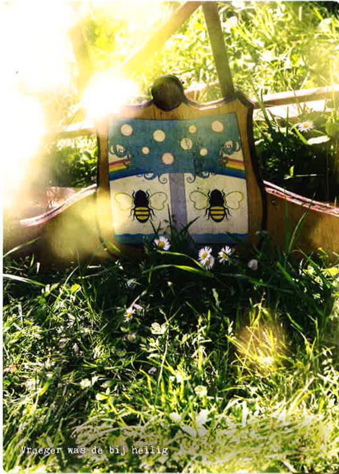
'roeger was de bij heilig