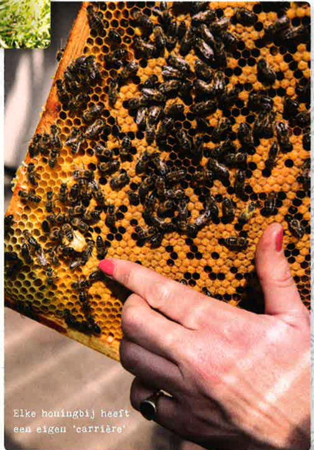
Elke honingbij heeft een eigen 'carrière'

'HONING IS HET SYMBOOL VAN VOORSPOED, LIEFDE EN VOORTPLANTING. DE TERM 'HONEYMOON' HERINNERT DAARAAN'